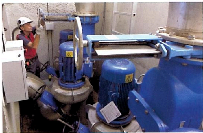
Poste de relèvement du Pédégal

Situé en limite des communes de Fréjus et Saint-Raphaël, il posait d'importants problèmes d'odeur dans un environnement urbain dense. Ce poste reprend la majorité des effluents provenant de la commune de Saint-Raphaël, pour les refouler vers la station d'épuration du Reyran. Les travaux ont consisté à renouveler les trois pompes en fosses immergées existantes par une installation de pompage en ligne constituée de quatre pompes.